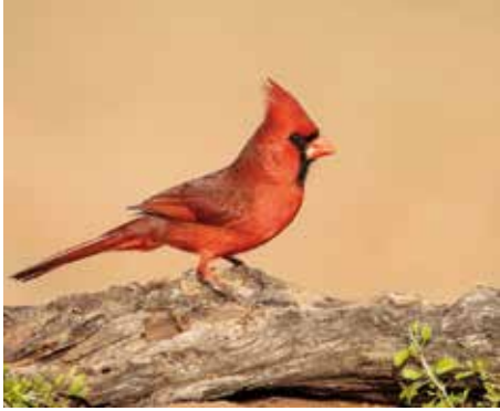
Roter Tanagra oder Rotkardinal

der tschechischen Enklave Spillville in Iowa durch. Bei einer dieser Proben verhaspelte sich Dvořák an der ersten Geige in den hohen Lagen und rief: „Pfui, verflixter Vogel!“, woraufhin ihn die anderen verdutzt anschauten. Er erklärte ihnen, dass er gleich am ersten Morgen nach der Ankunft in den Wäldern um Spillville einen kleinen roten Vogel mit schwarzen Flügeln und besonders schönem Gesang entdeckt habe. Ornithologen haben diesen als den roten Tanagra identifiziert, dessen Ruf Dvořák relativ tongetreu zitiert hat – bis in die gefährlich hohen Lagen der Geige hinein.