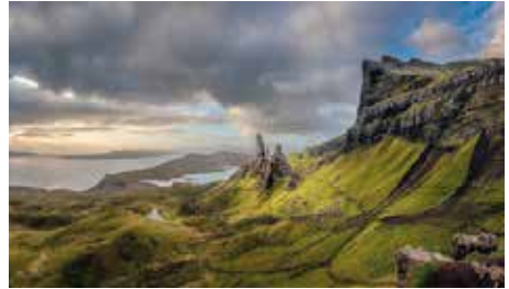
Isle of Skye, Innere Hebriden

Die Aufführung der 3. Fassung fand am 10. Januar 1833 unter Mendelssohns Leitung in Berlin statt. Die Ouvertüre ist ein Orchester-